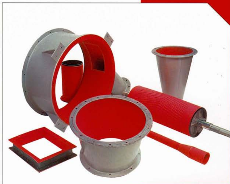
Linatex gummeringar, drivtrumma och tillverkade detaljer.